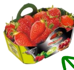
Panier carton ouvert env. 250g