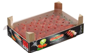
Baby colis bois lités 1 rang 800g et 1kg