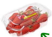
Barquette "macaron" 250g