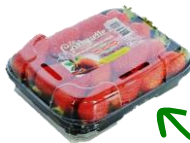
Barquette litée 250g