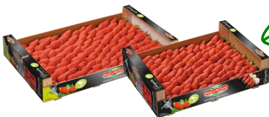
Plateaux bois lités 1 rang 2kg et 1,8kg